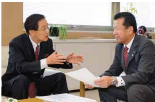
副村長時代から仲間であった山田修東海村長と、 人口増の東海村の現状と行政について 説明を受け意見交換をする