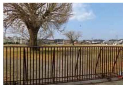
今後の利活用策を考える日本たばこ産業跡地