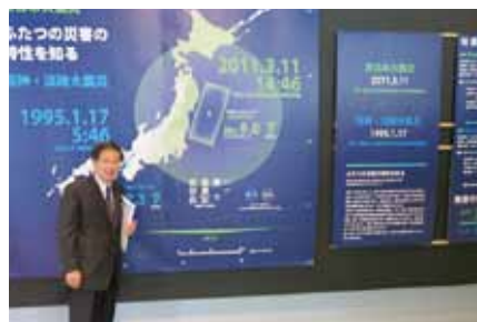
3.11東日本大震災パネル(防災未来センター)