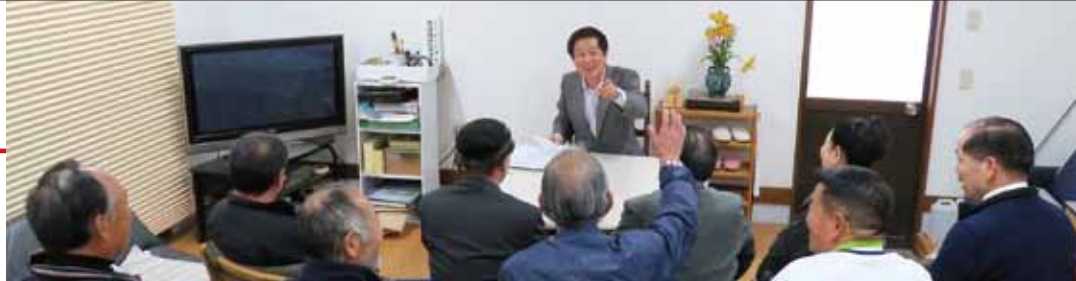
市民の皆様と議論する