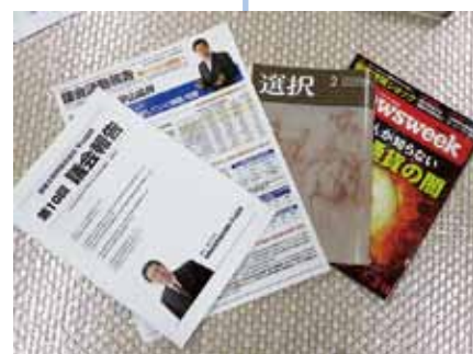
議会報告の発行と情報誌