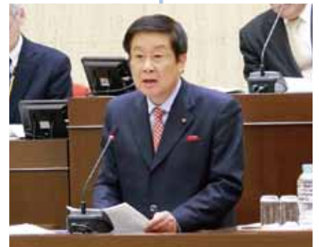
市民からの要望、課題、提案を一般質問を通じて議論する

私にとって市民に代わって議会という公の場で市行政に対して質問や質疑をしない事は考えられません。これからも市民目線、市民感覚で議会の場を通じて市長始め執行部と公開の中で実りある議論や提案をまいります。