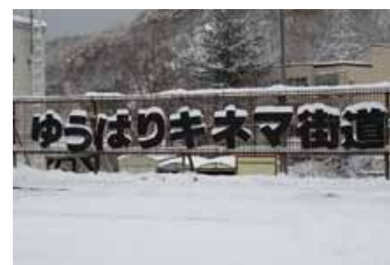
夕張映画祭の名残り