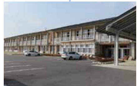
新築なった金砂郷中学校

この4年間は議員として、その他、様々な課題、問題を執行部の皆さんと議論してまいりました。