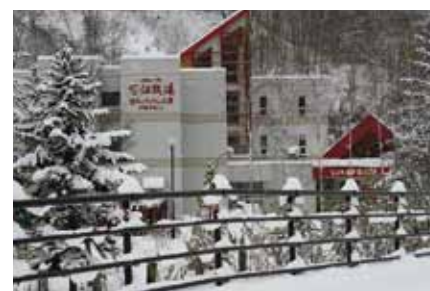
夕張市の施設を「花畑牧場」が買収