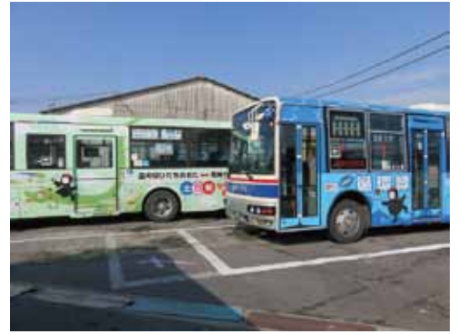
市民が使いやすい地域公共交通の核になる循環バス