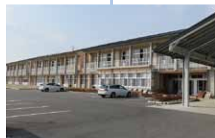
新築なった金砂郷中学校

この4年間は議員として、その他、様々な課題、問題を執行部の皆さんと議論してまいりました。