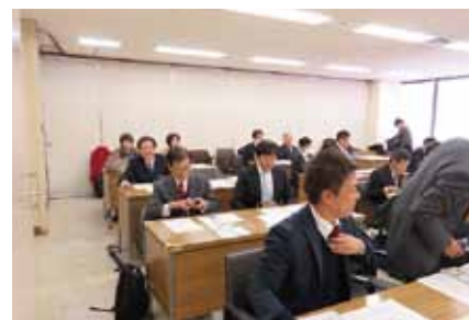
「夕張の財政再建と地域再生の取り組み」を研修