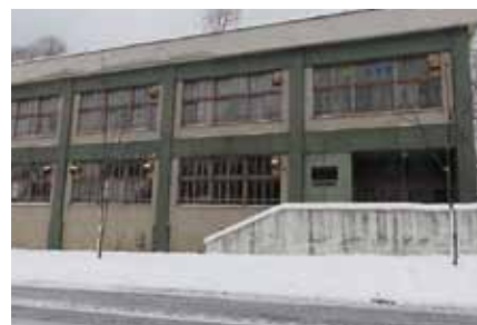
廃墟になった夕張市図書館