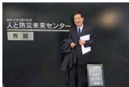
兵庫県、人と防災未来センター