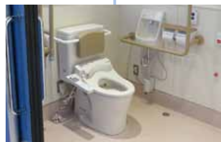
災害時に避難所となる小・中学校に多目的トイレを整備する