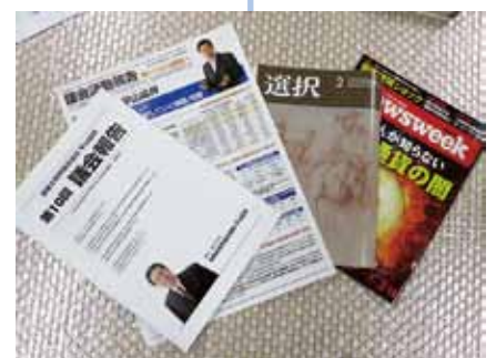
議会報告の発行と情報誌