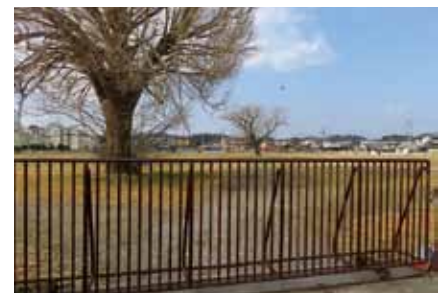
今後の利活用策を考える日本たばこ産業跡地