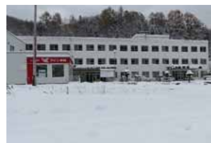
夕張市民病院が廃院になり民間クリニックへ