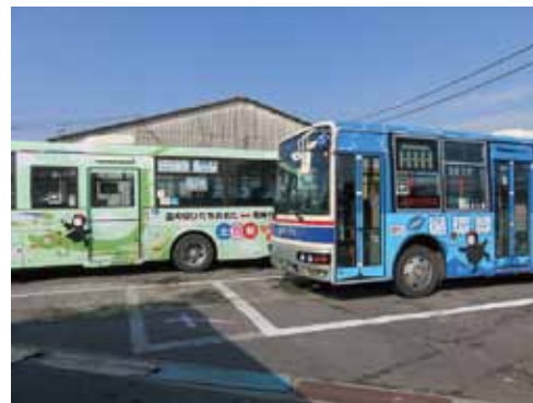
市民が使いやすい地域公共交通の核になる循環バス