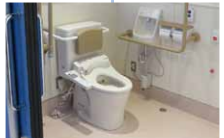
災害時に避難所となる小・中学校に多目的トイレを整備する