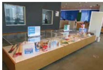
地震・災害時の防災グッズ展示(防災未来センター)